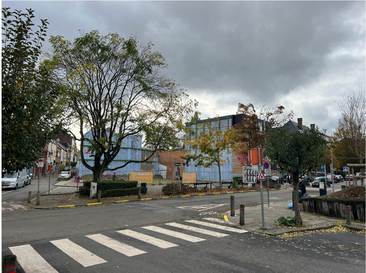
Prise de vue 1