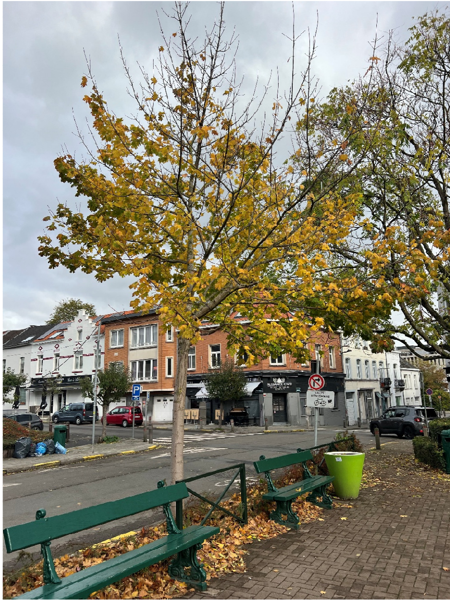
Prise de vue 3