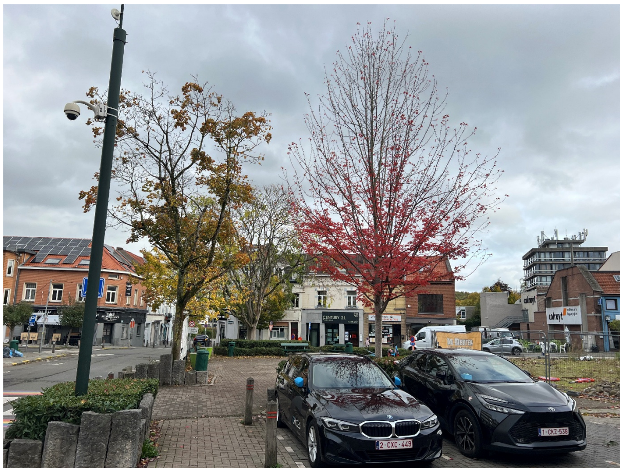
Prise de vue 7