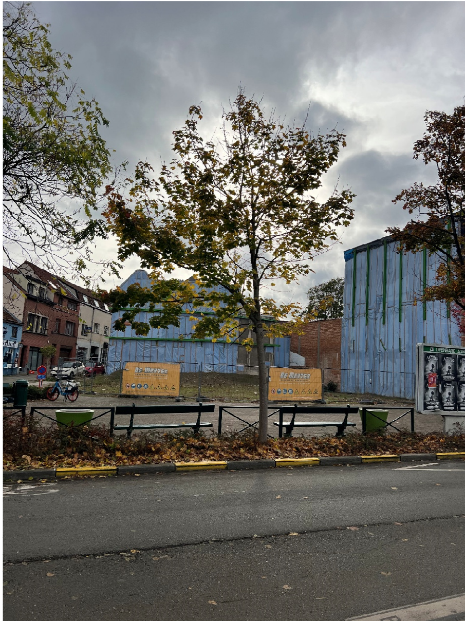
Prise de vue 2