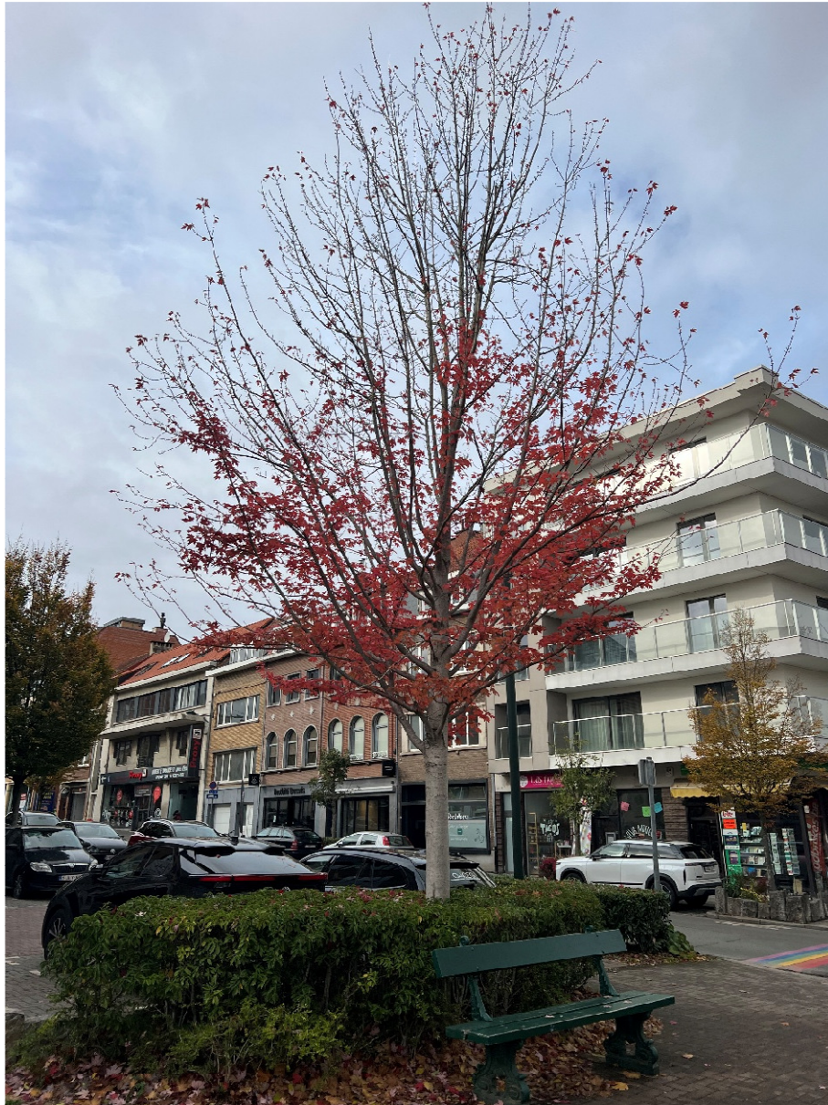
Prise de vue 6