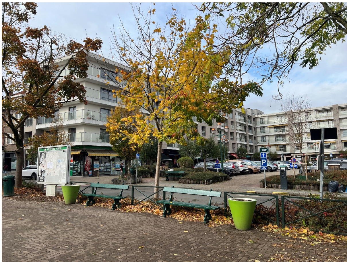
Prise de vue 4