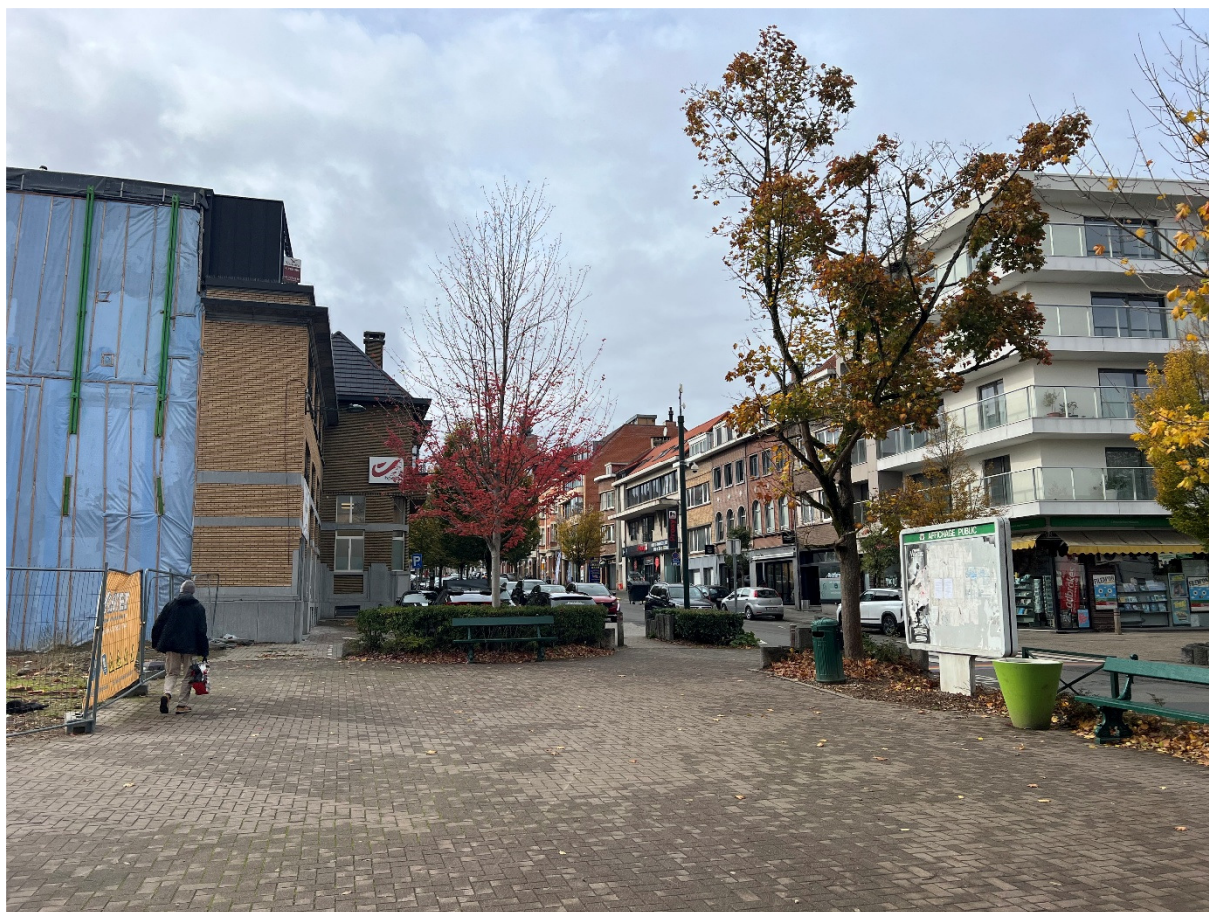
Prise de vue 5